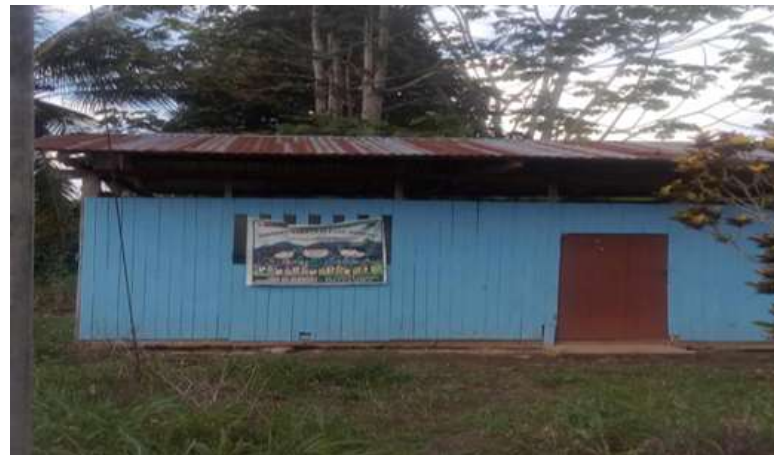
FIGURA N°03: SE APRECIA LAS VIVIENDAS QUE SON AFECTADAS ANTE EL DESBORDE DEL RIO HUALLAGA.