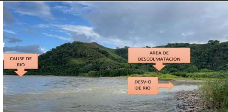
FIGURA N°01: SE OBSERVA TRAMO DONDE SE OBSERVA EL MATERIAL COLMATADO EN EL CAUCE DEL RIO HUALLAGA