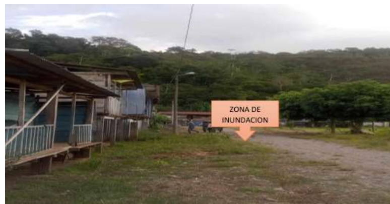
FIGURA N°02: SE APRECIA LAS VIVIENDAS QUE SON AFECTADAS ANTE EL DESBORDE DEL RIO HUALLAGA.